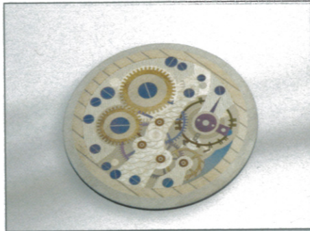
Décor laser d'un fond de montre.

"Un secteur d'activité très porteur qui correspond bien à nos facultés d'adaptation à la demande et qui participe à orienter puis structurer notre offre de machines standard".